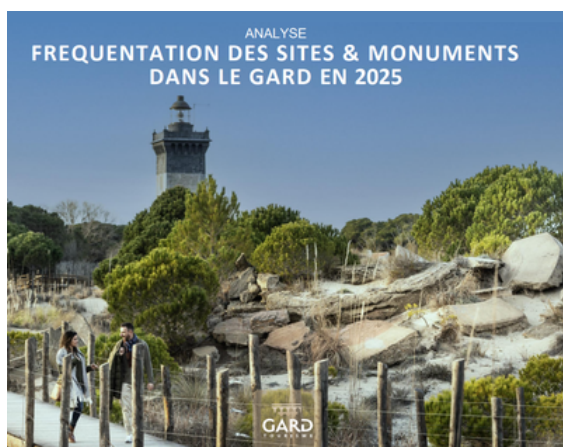
Fréquentation des sites et monuments gardois en 2025

Toutes nos études sont disponibles sur protourismegard.com/observation-et-prospective/