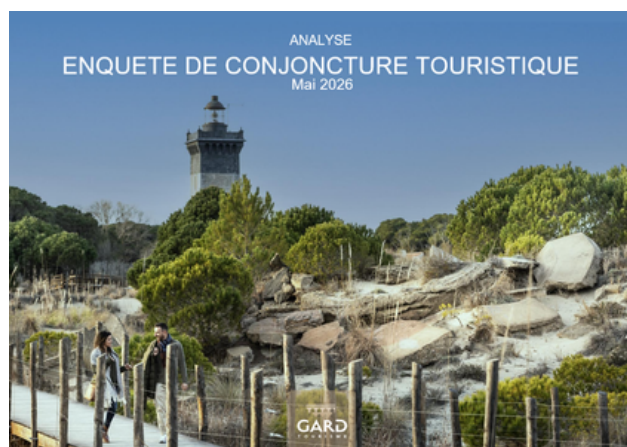
Enquête de Conjoncture - Mai 2026